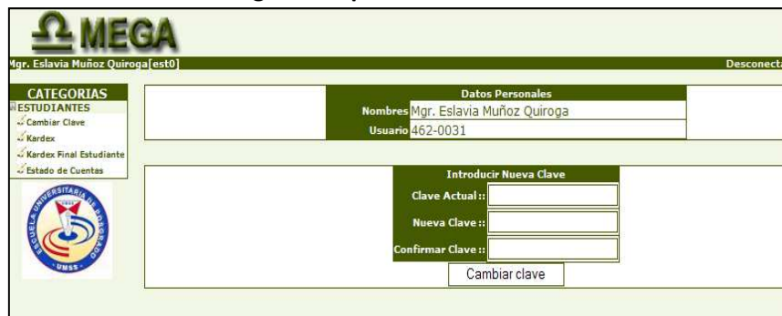
Figura 3. Opción cambiar clave