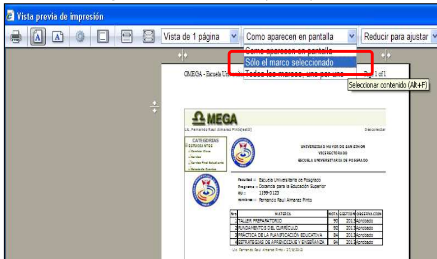
Figura 7. Elección del sector para imprimir

9. Seguidamente elija la opción imprimir representada por la impresora, Figura 8: