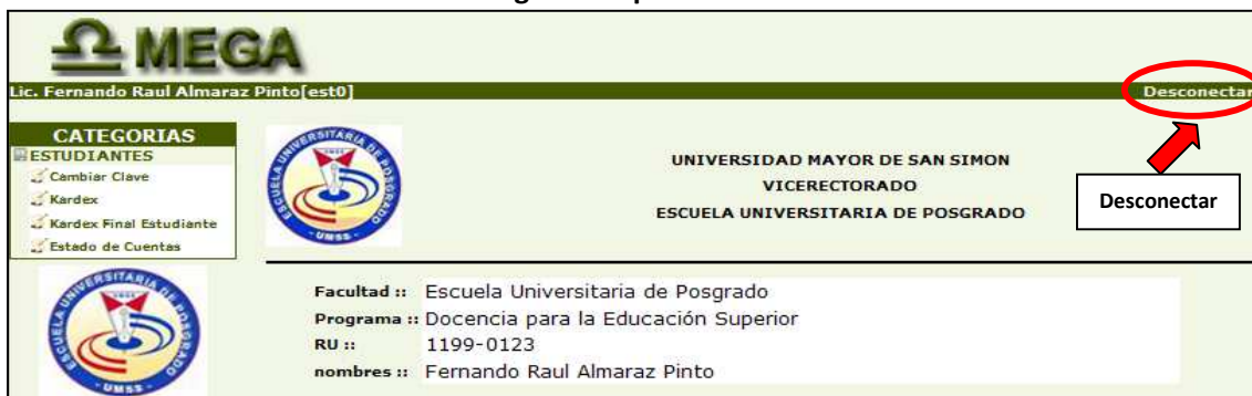
Figura 9. Opción salir

10. Para salir del sistema haga clic en la opción Desconectar , Figura 9: